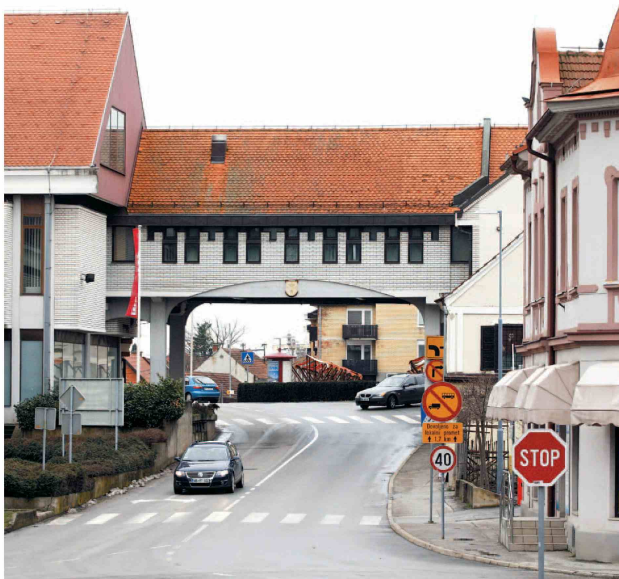
V zadnjih letih je bilo pet predlogov za referendum, izpeljali so le enega. (Janko Rath)

tisoč evrov je ormoški proračun stal referendum o muzeju