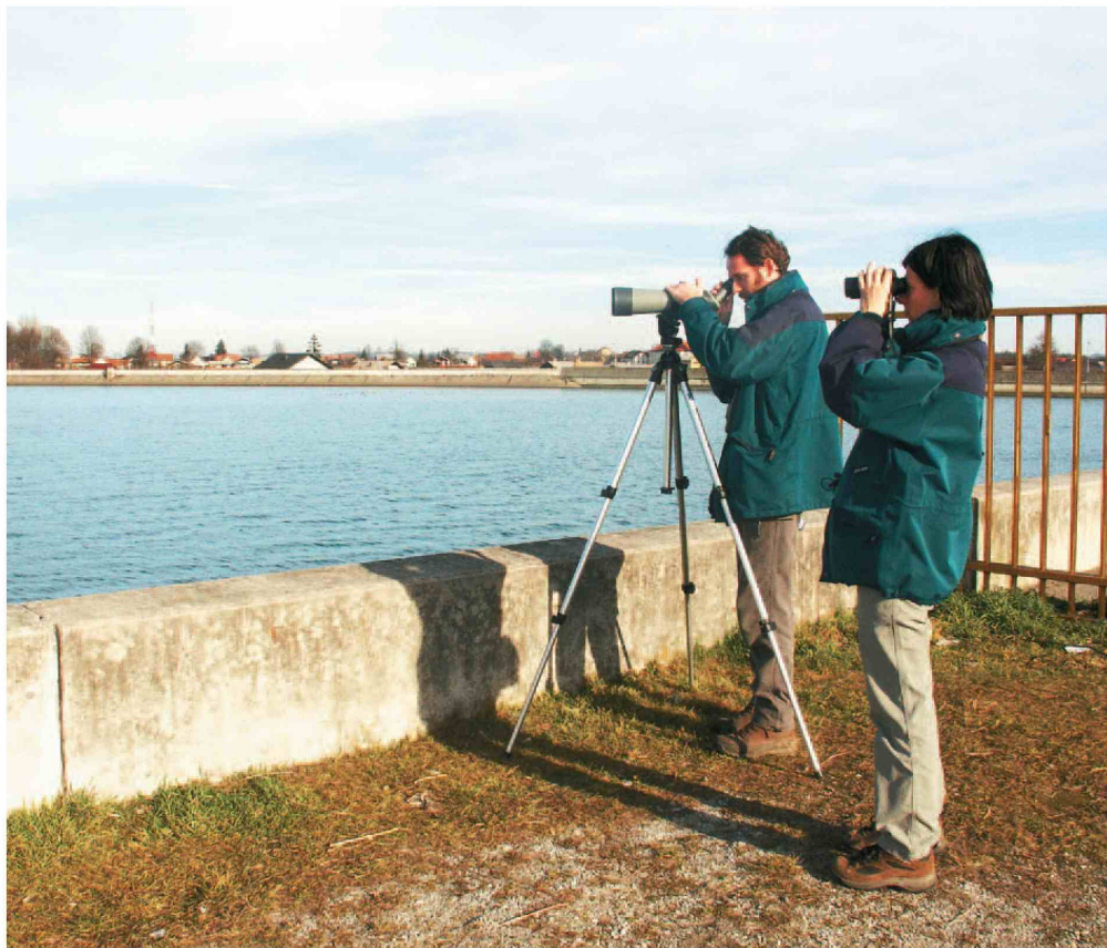
Člani Društva za opazovanje in proučevanje ptic Slovenije vidijo v zaščiti ormoške lagune priložnost za ohranitev ogroženih vrst ptic. (Slavica Pičkerko Peklarič)